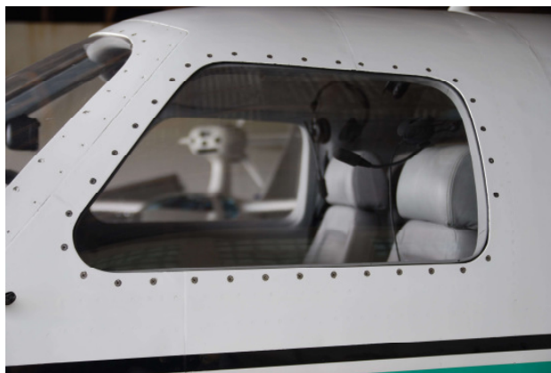
6. AUSSENANSICHT NACH EINBAU DER ISOLATIONSSCHEIBE GEGEN BESCHLAGEN ODER VEREISUNG